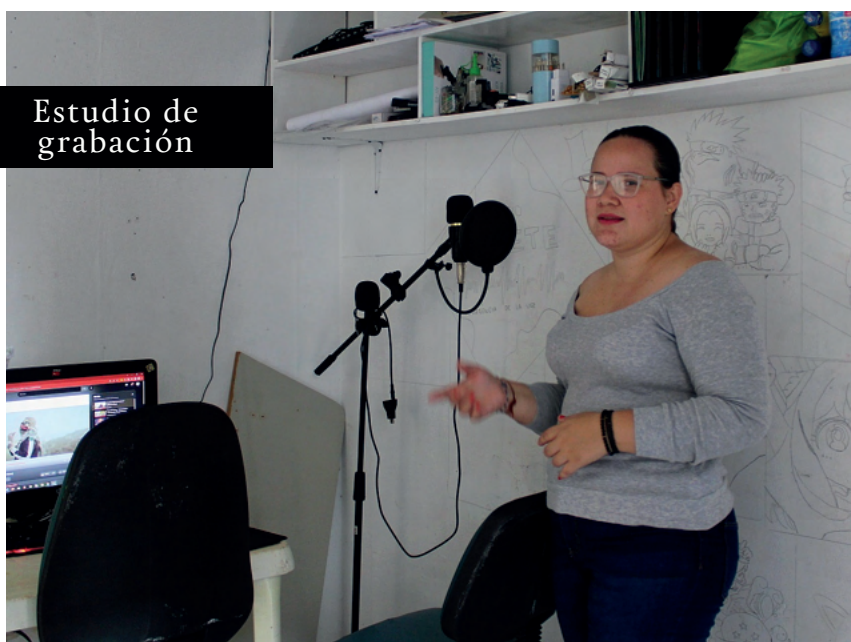
Estudio de grabación