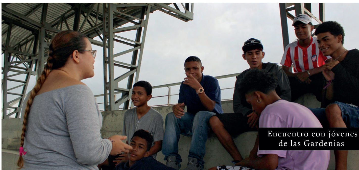
Encuentro con jóvenes de las Gardenias