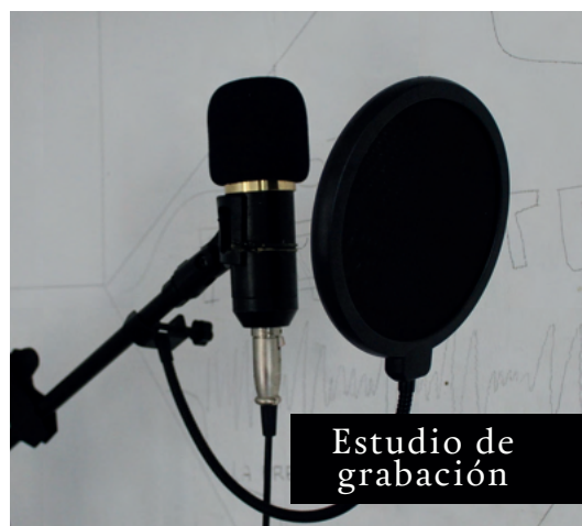
Estudio de grabación

Este proceso ha sido posible gracias a Fundación Foro con el financiamiento de Brot Fur die welt (Pan Para el Mundo).