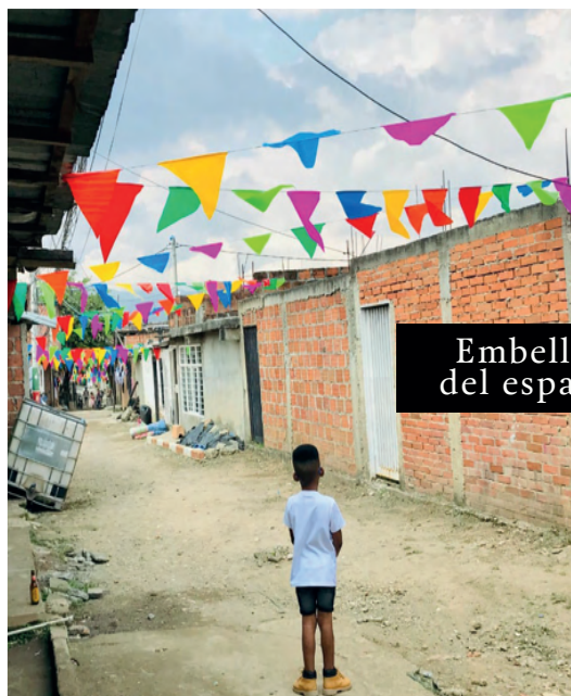
Embelllecimiento del espacio público